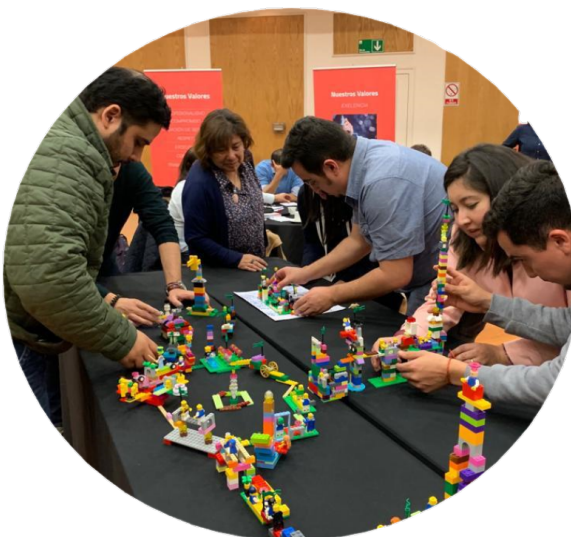
Taller Lego Serious Play